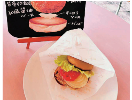
トロトロのクリーミーなバーガーを作ってみよう！

管理栄養士は食と栄養の知識を生かして、食の魅力を見つけ、新しいおいしさや価値を生み出す仕事にも関わっています。食べることや地域に関わる仕事に興味がある人、一緒に食の可能性を考えてみませんか。