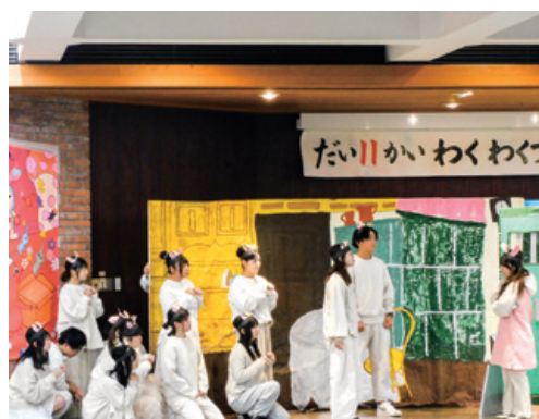
わくわくフェスティバル