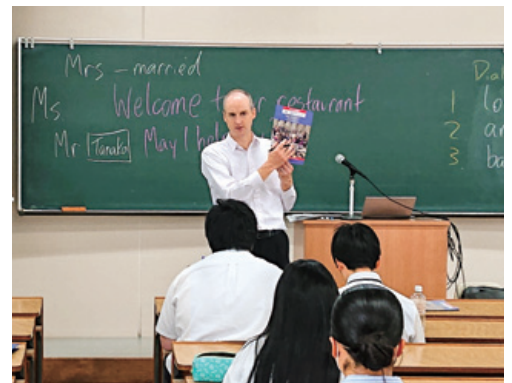
「ここではこう言う」を知れば、英会話力は格段にアップします

マンガやイラストなどは平面芸術ジャンルではありますが、解剖学の知識と立体的な想像を通じて多様な角度の表現ができあがります。今回の模擬授業では、キャラクターの多様な角度表現の基礎として、頭部の側面を描く方法を説明した後、ワークショップを行います。