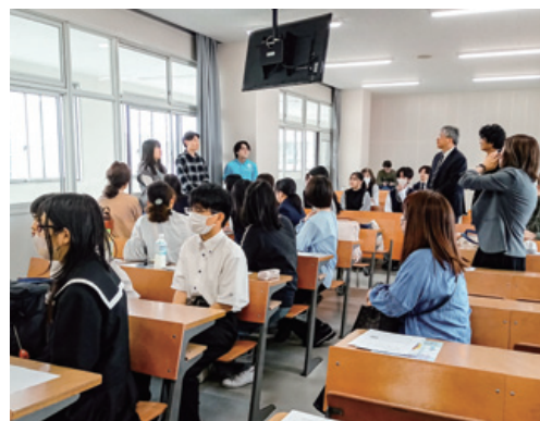
先輩方にもぜひ聞いてみましょう！

人間関係学科の先生方はもちろん、現役の学生である先輩方にも皆さんが気になることを聞いてみましょう。