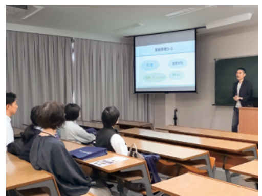
解剖学でキャラクター作画の基礎を知ろう!!