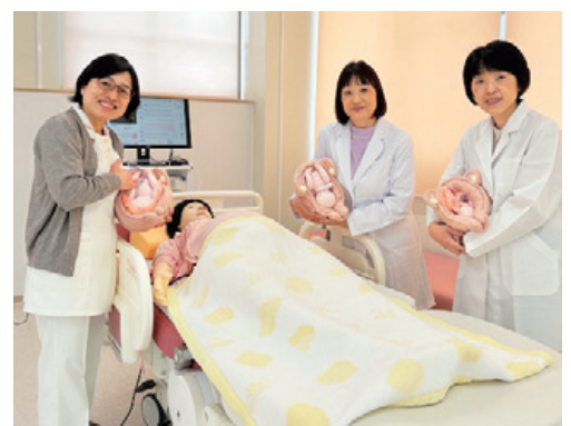
母性看護学のシミュレーションを体験してみよう！