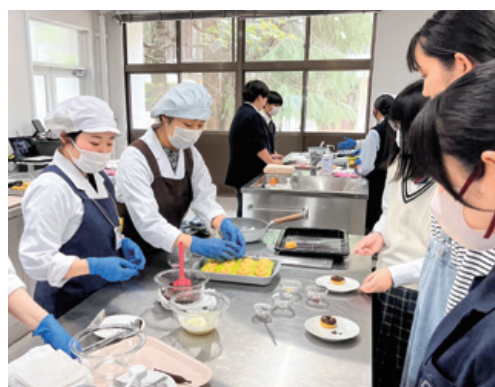
模擬授業では学生と一緒に楽しく調理します