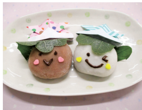
つくって楽しい！ 伝統のお菓子をかわいくアレンジ 柏餅づくり体験

5月5日は「こどもの日」。「端午の節句」ともいい子どもの成長を祝う五節句の1つです。端午の節句に食べられる伝統的な和菓子に「かしわ餅」があり、その由来は子孫繁栄や家系の継承を願う意味が込められています。上新粉で作った生地にあんこを包むだけで簡単に作ることができます。今回はこの季節のお菓子を可愛くアレンジして自分だけの「オリジナルかしわ餅」を作ってみましょう。