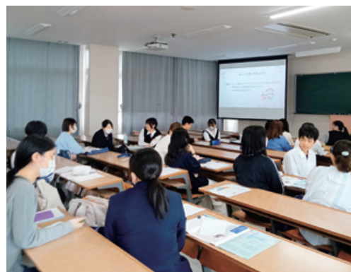
大学での授業を体験してみましょう！