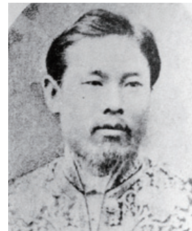
大日本帝国憲法を作った伊藤博文

大日本帝国は、議会より政府と軍部の力が強く、軍部が時として政局を支配した時代遅れの国家だったといわれます。しかしそれと同時に、当時の日本は19世紀のヨーロッパ諸国を研究し尽くして作られた、最先端の国家でもありました。そんな国家が後世に言われるような評判を得たのはなぜでしょうか？ 人間、国内情勢、外交環境の変化に、国のかたちが適応できなくなっていく様子を見てみましょう。