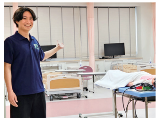
最新の施設をご案内します！

本学で使用しているシミュレーターを活用し、妊婦さんとおなかの赤ちゃんの状態について知ることを目的とします。おなかの中で育つ赤ちゃんは、どのように成長するのでしょうか。胎児の成長についてミニ講義を行います。その後、妊婦体験と胎児モデルを手に取りながら、いのちの大きさや重みを実感します。さらに、妊婦モデルを用いて、おなかの中の赤ちゃんの位置を確認し、胎児の心音を聴く体験も行います。自分達の心拍数との違いを確認してみましょう。まだこの世に存在しないいのちの鼓動に触れる瞬間。看護の仕事が「いのちを支える仕事」であること、きっと体感できるはず。ぜひ、その学びの一端を体験してください。