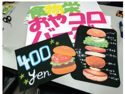
学生も一緒に商品開発に取り組めます！