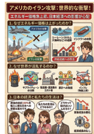
中東情勢と日本のエネルギー危機