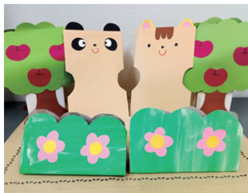
どんな楽しいお話が生まれるかな？

今回の模擬授業では、手作りパペットを使って、簡単な「お話あそび」をします。幼児期は、言葉の楽しさや美しさに触れ、言葉の感覚を豊かにすることが大切です。みなさんも、お話あそびを通して、言葉がもつ音の響きやリズムを楽しんでみませんか？ 参加者や在学生とお話ししながら、みんなで一緒に豊かな言葉の世界を味わいましょう。