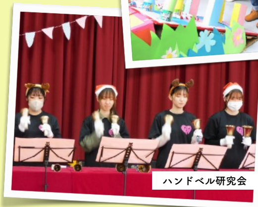
ハンドベル研究会