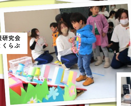
子育て支援研究会 びすけっとくらぶ