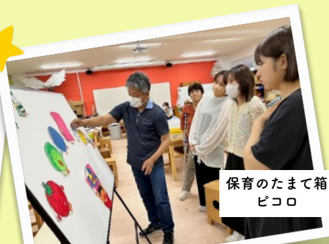
保育のたまたま箱 ピコロ