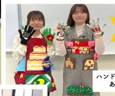
ハンドメイド研究会 あっぷりけ