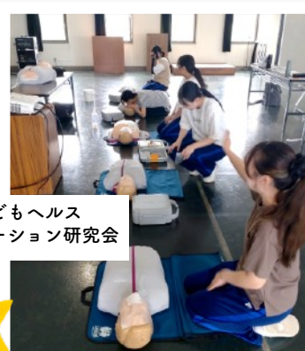
子どもヘルス プロモーション研究会