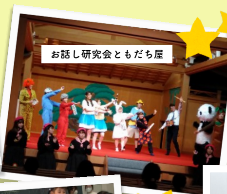
お話し研究会ともだち屋