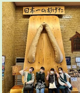
ジャンボ下駄にビックリ

今年度は日田市の豆田町散策と三和酒類㈱いちち日田蒸留所の見学をしました。梅雨入り、台風などで天候が心配されましたが、嬉しいことにこの日は雨もほとんど降らなかったため、オリエンテーションを満喫することができました。