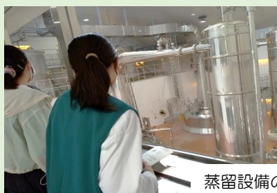
蒸留設備の説明を熱心に聞いています