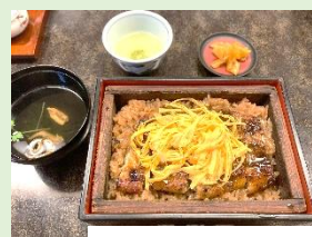
豆田町のランチはうなぎが人気でした