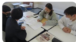
1・2年生の交流会の様子です！