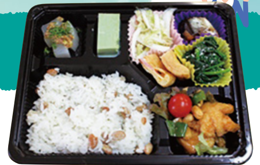
平成26年度減塩弁当

オリジナルの 減塩弁当 を 無料で配布します! お弁当を食べながらセミナー に参加しましょう!