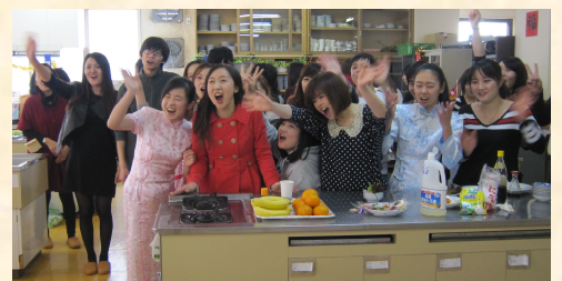
1月23日 春節 餃子交流会パーティー