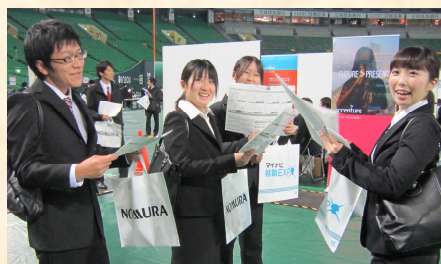
1月21日 マイナビ合同説明会 (福岡ドーム)