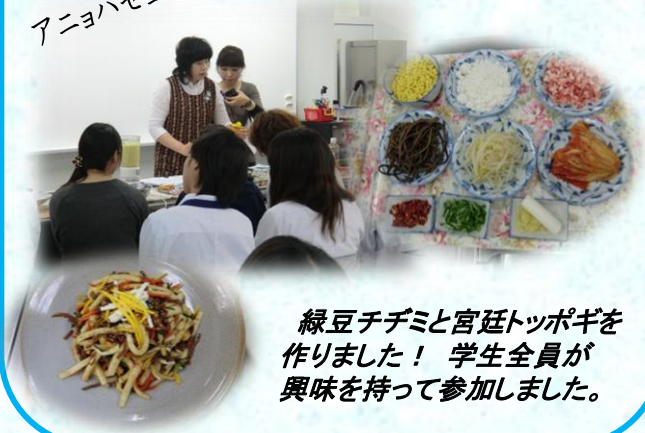
緑豆チヂミと宮廷トッポギを 作りました! 学生全員が 興味を持って参加しました。