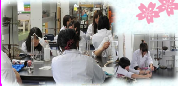
1年次の生化学実験の様子

4月5日(火) 新入生(55名)が入学! 「真理は我らを自由にする」という 建学の精神を学んでいきます。