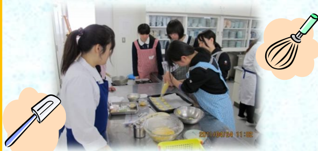
模擬授業では在学生とともに 野菜スイーツを作りました!