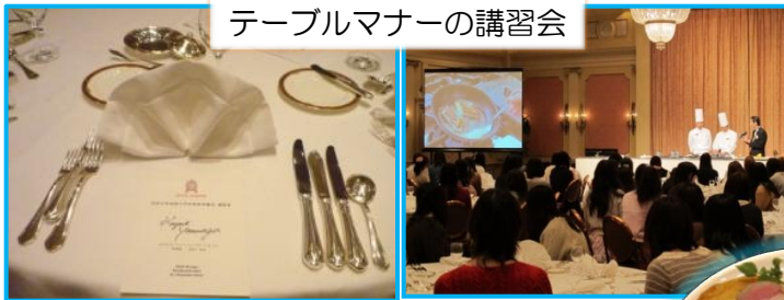
テーブルマナーの講習会

1泊2日の「長崎ハウステンボス・佐世保 食の旅」を行い、長崎の食文化を学びました。