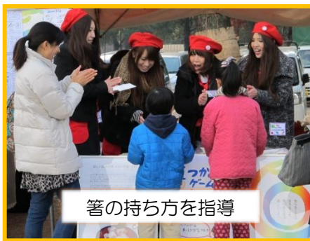
箸の持ち方を指導