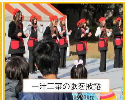
一汁三菜の歌を披露

平成23年度は豊後高田市「鍋フェスティバル」、別府市「わくわく農業フェア」に参加しました！